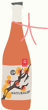
Cambridge Road Naturalist Rosé