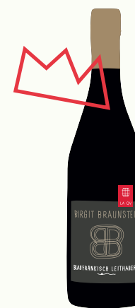
Birgit Braunstein Blaufränkisch