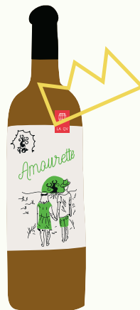
Les Hauts de Riquets Amourette